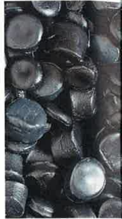
PP-Compound auf Rezyk